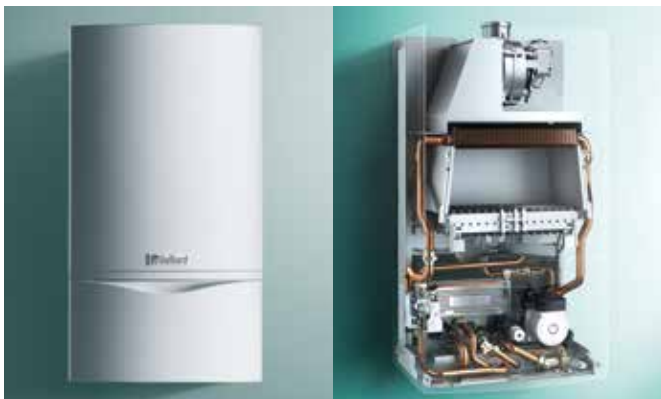
Caldaia tradizionale a tiraggio forzato

I prodotti immessi sul mercato prima del 26/09/2015 che non rispettano i requisiti della nuova direttiva, come le caldaie tradizionali a tiraggio forzato e le caldaie non dotate di pompa ad alta efficienza, potranno essere comunque acquistati, venduti e installati.