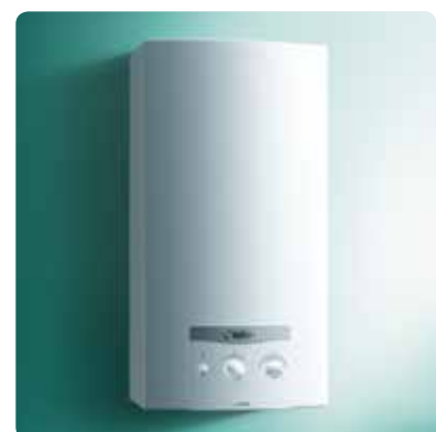
atmoMAG mini GX

Disponibile nella sola versione a metano.